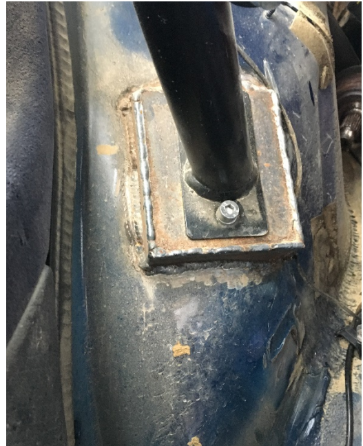
Abstützung ins Heck