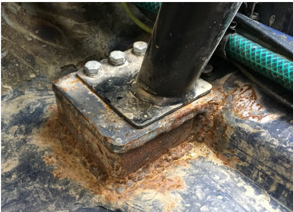
Rohr auf Bodenplatte

Der Überrollbügel darf keinesfalls direkt auf das Chassis aufgeschweißt werden. An den Enden der Rohre muss eine Verstärkungsplatte mit mindestens 3mm und einer Mindestfläche von 8x8cm angeschweißt werden. Idealerweise mit einem Winkel am Holm. Hier 2 Beispielbilder