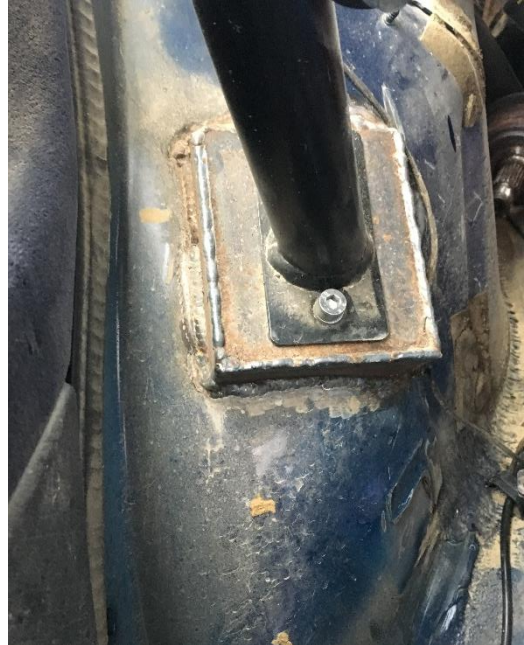
Abstützung ins Heck